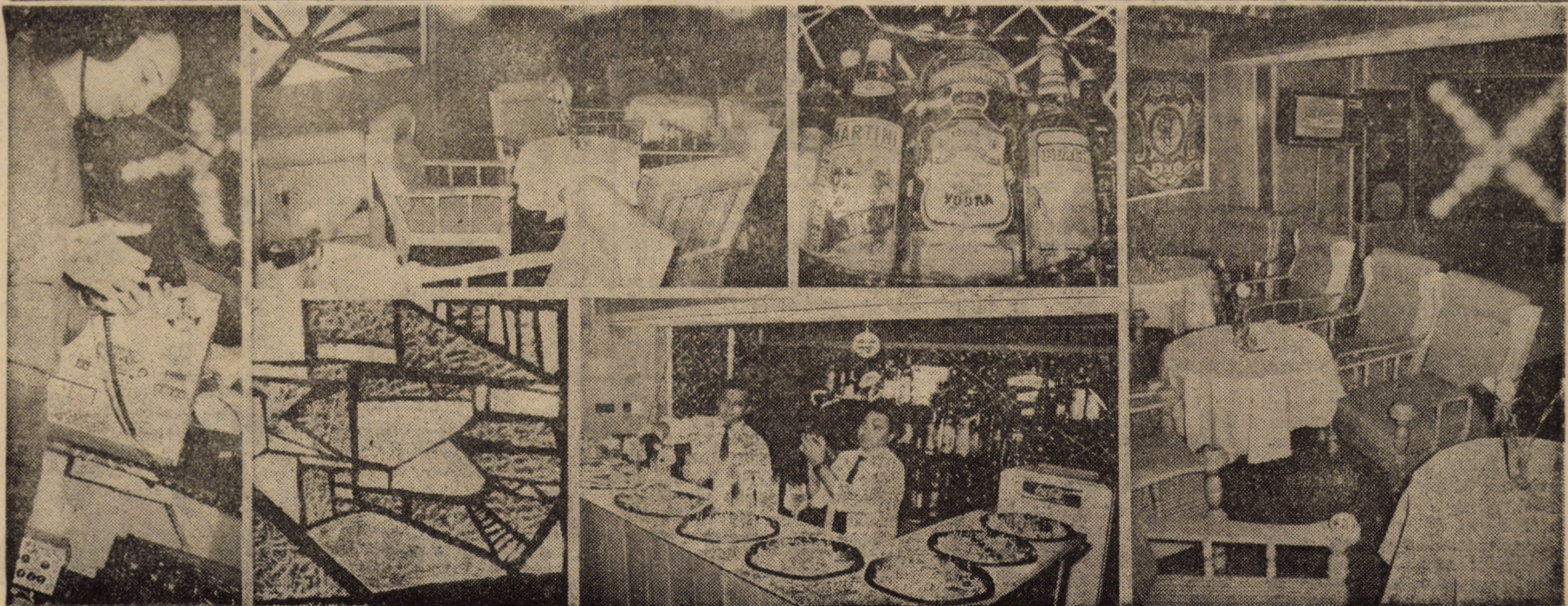
Citiți în pagina a IV-a, reportajul „Barul Continental, o atracție de ultimă oră”.