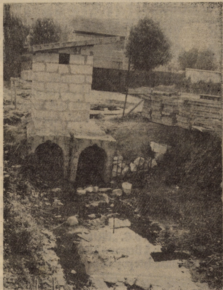
Cei care construiesc Centrul de medicină preventivă (CMP) s-au gîndit să facă lucru trainic și așa au și făcut. Au ridicat un WC chiar pe cursul pîrului ce trece prin curtea viitorului CMP. Să vedem pe cine amendează forurile competente... Să vedem!

Surprinzător, acum cînd intrăm în plină vară, am rămas în panoramicul nostru doar cu sportul rege — fotbalul. Așadar, sîmbătă, 13 iunie, în cadrul ultimei etape a diviziei C, pe stadionul Voința din Sibiu, de la ora 11 aveți prilejul de a asista la derbyul județean dintre echipele „U” Hidrocon Sibiu și Carpați '90 Agnita. În partida tur, la Agnita, sibienii au cîștigat cu 1-0. În divizia B sînt programate partidele etapei a 33-a (penultima), în care echipa sibiană Șoimii Compa întîlnește, pe teren propriu, de la ora 11, pe Metalul Bocșa. Gaz metan Mediaș încearcă, la Cugir, în fața formației locale Metalurgistul, să obțină măcar un egal pentru a viza locul „12”. Dacă ținem cont că în tur, la Mediaș, scorul a fost de 4-0 în favoarea medieșenilor, credem că este posibilă și victoria. În primul eșalon, duminică, 14 iunie, elevii antrenorului Jan Gavrilă, de la F.C. Inter Sibiu, joacă la Brăila cu Dacia Unirea, echipă pe care în tur au învins-o cu 1-0. În sfîrșit, duminică, de la ora 11, pe terenul Textila, echipa locală Textila '91 Cîsnădie, întîlnește în meciul tur (baraj pentru divizia B) pe Dermata Cluj.