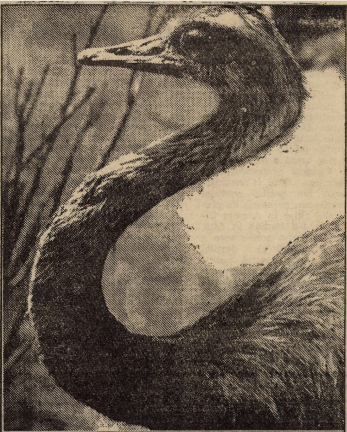
Profilul meu, paradoxal, / Spun unii că ar fi banal, / O fi sau nu original, / E unic, e... sinusoidal! Text și foto: Fred NUSS