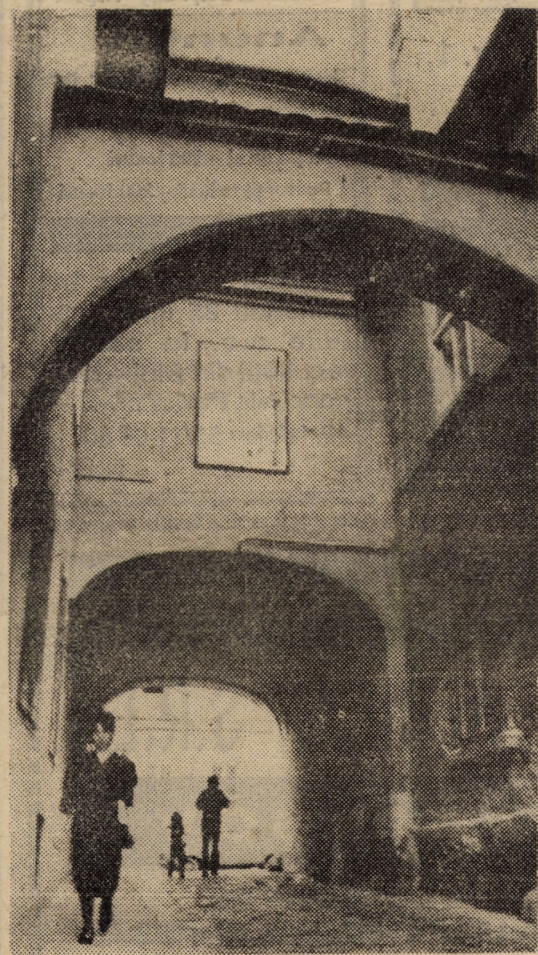
Trecute vieți de doamne și domnițe?