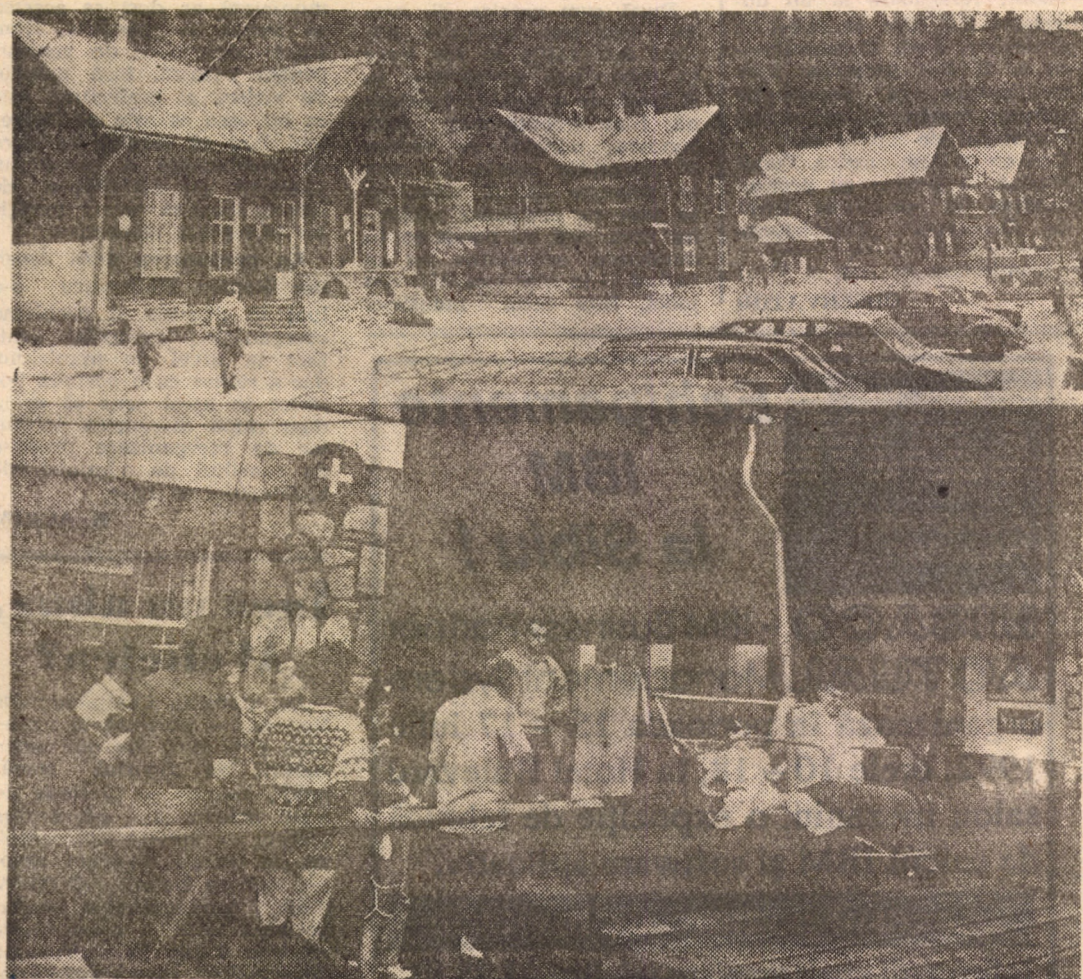
Idee pentru concediul dumneavoastră

Informații suplimentare se pot obține de la Asociația „Umanitas” din Sibiu, Piața Mică nr. 16, sau telefon 92/41 81 04, (nu 92/41 31 04 cum a apărut din greșeală anterior) în zilele de luni, marți, joi și vineri, orele 10—14.