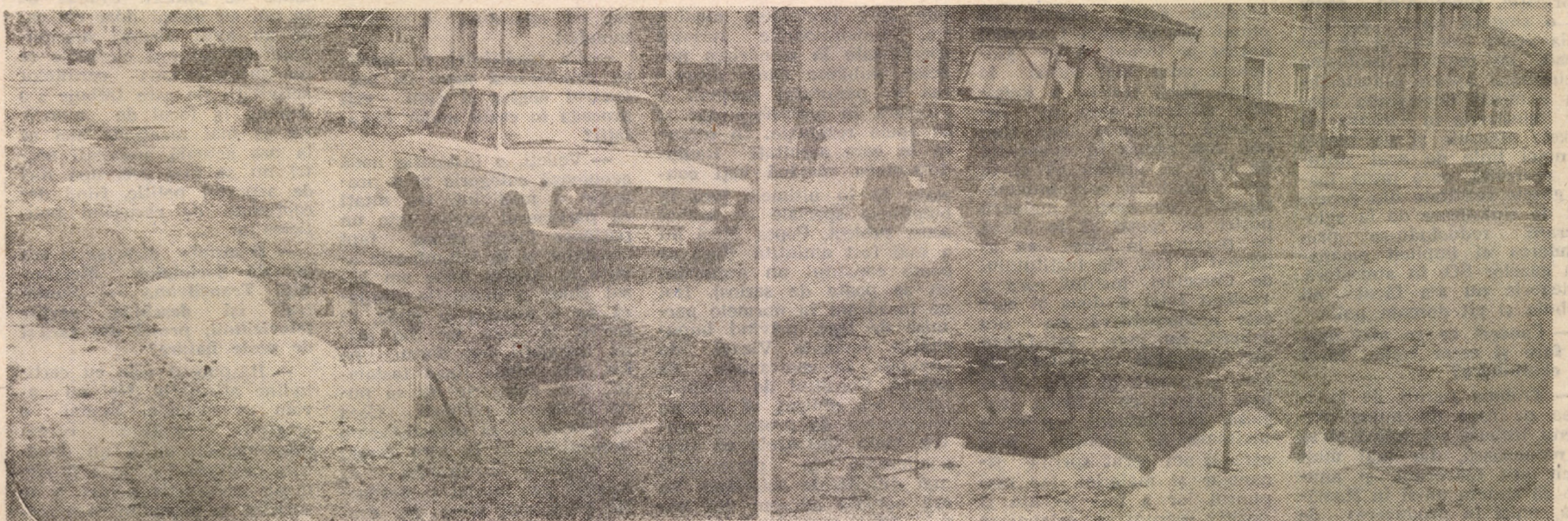
De vreo 3 ani de zile, pe strada Lungă nu se mai încumetă să treacă decît „așii” volanului... Asfaltul cumplit de deteriorat, gropile mustind de ape pluviale, au transformat zona într-un poligon special de îndeminare, extrem de dificil... Edili orașului nu locuiesc pe aproape... din fericire pentru ei, din nenorocire pentru sibienii de rînd... cei lipsiți de putere de decizie!!!

Noroc că tot americanii și-au propus să ne dea și ceva griu, că altfel ne măcinam doar nervii și... sărăcia. I.T.