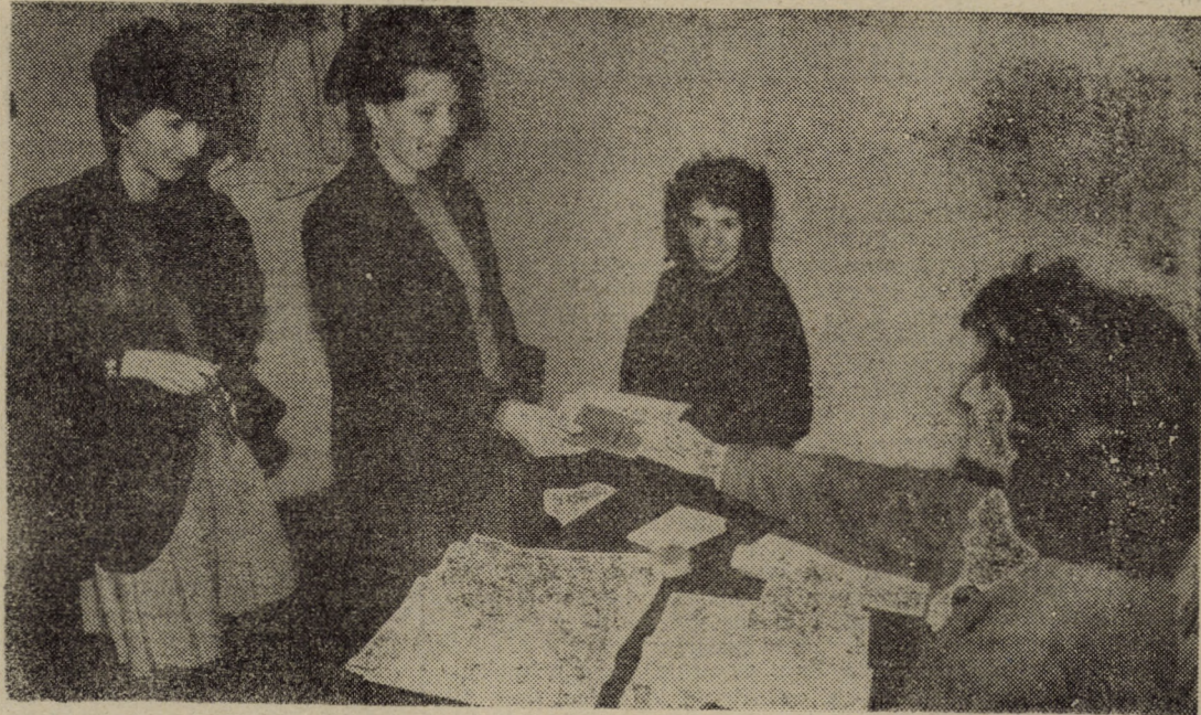
Pină în 6 octombrie cetățenilor din județul Sibiu li s-au eliberat 234 046 certificate de proprietate, ceea ce reprezintă 72,82 la sută din numărul total de eliberat. Pe această cale amintim celor 87 372 de cetățeni care nu și-au ridicat certificatele că și le mai pot „elibera” pină în data de 26 noiembrie a.c.