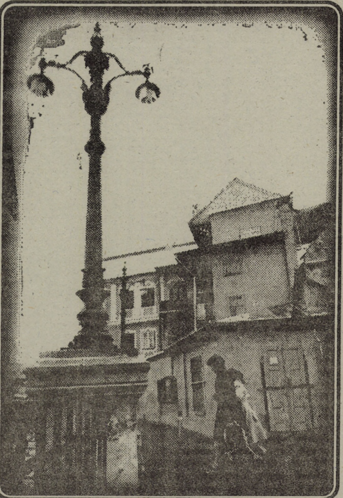
A orașului fațadă Ca și-a omului frumos, Uneori nu e paradă, Căci valorile-s... pe dos!