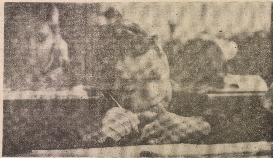
Oare acești copii vor ajunge și ei să studieze în America?