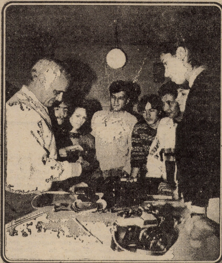
Primele ore la Facultatea de jurnalistică Sibiu

Din acest moment discuția reînnoită cu directorul Casei Corpului Didactic Sibiu a alunecat spre o problematică mai „incomodă”, dar deosebit de interesantă prin rezolvarea ei. Din ineditul acestei problematice se detașează înființarea unui club al dascălilor (gen Casa universitarilor). Dar despre asta avem să purtăm o discuție într-un cadru mult mai reprezentativ. Pînă atunci așteptăm propunerile celor interesați.