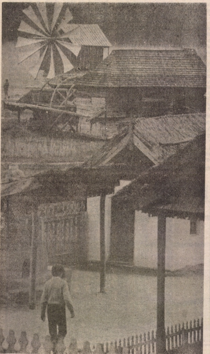
Unități ale Muzeului Civilizației Populare din România — un punct de atracție pentru cei ce vizitează frumoasa Dumbravă a Sibului.