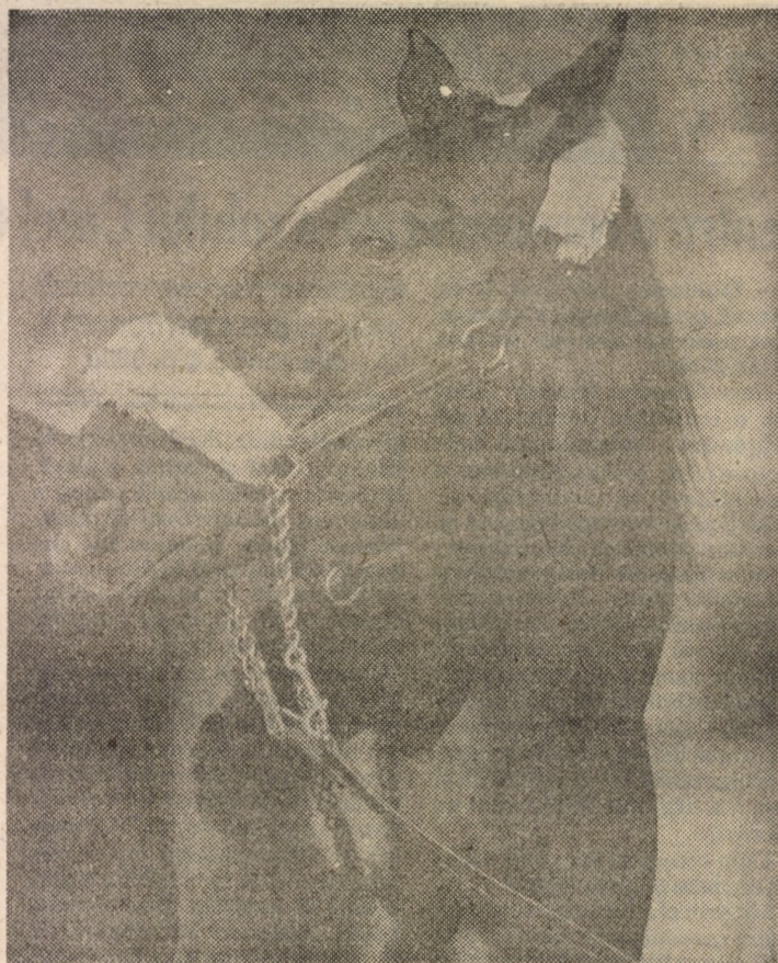
„Nu mor căii cînd vor ciinii” — zicală populară românească.