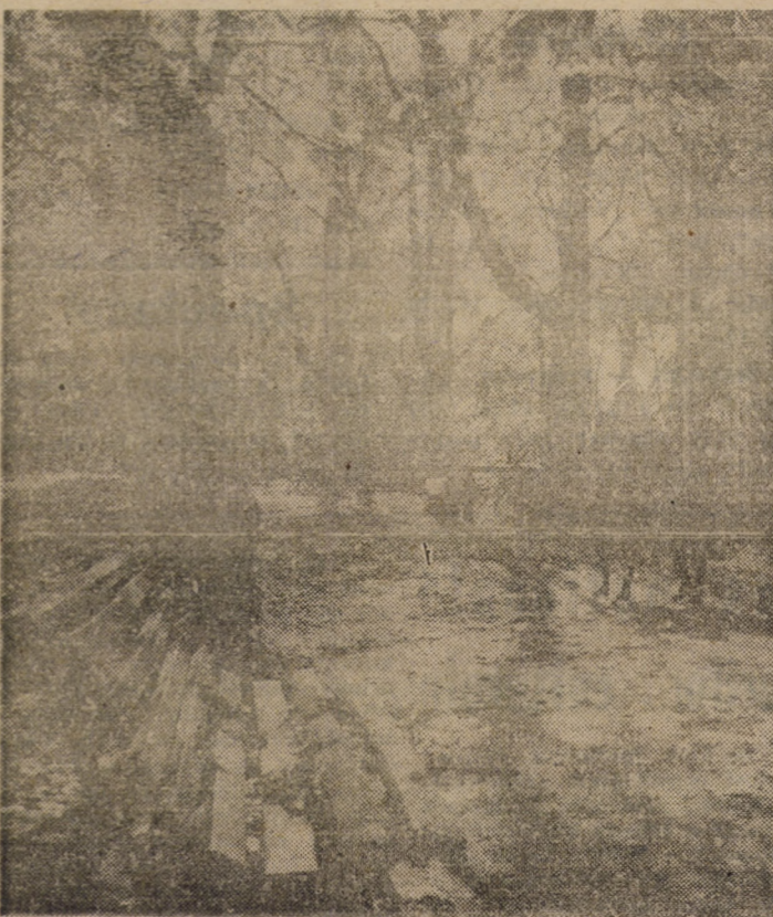
Trecem prin toamnă mai incovoiați de griji și mai desfrunziți de speranțe.