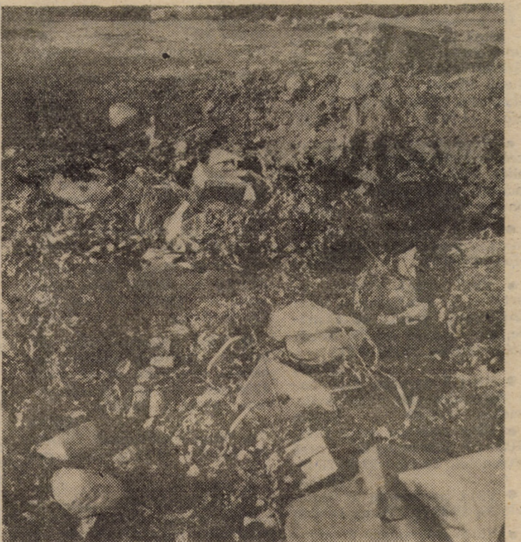
Problemă ecologică sau... curată nesimțire. După cum o atestă și fotografia de față, într-un loc deschis de lângă șoseaua națională care duce spre Mediaș, între localitățile Șura Mare și Slîmnic, niște iresponsabili (altfel nu-i putem numi) au transformat acea zonă verde într-o veritabilă groapă cu gunoaie. Ar fi de așteptat ca, prin forțe conjugate, oficialitățile din cele două localități amintite să-i surprindă pe depunătorii clandestini ai acestor gunoaie nedorite în acest loc, urmînd, evident, conform legislației în vigoare, pedepsirea aspră a acestora.