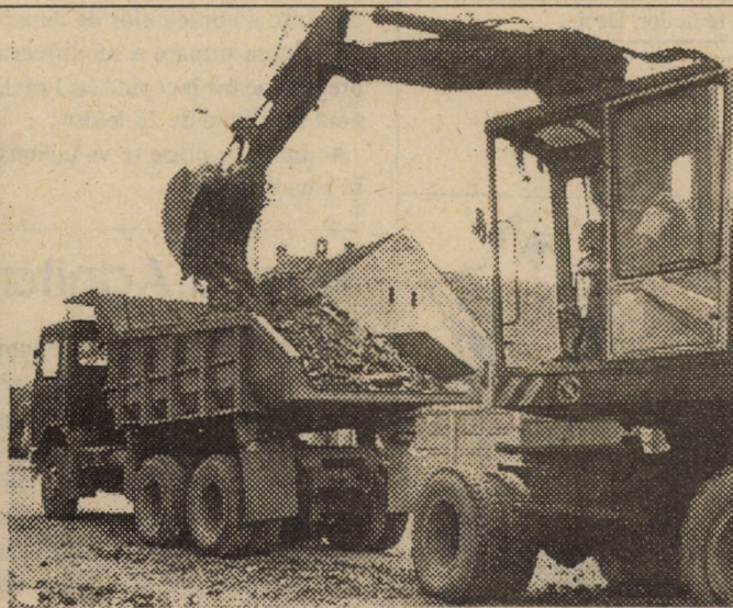
În sfîrșit pe strada Lungă (fostă 11 Iunie) au început lucrările de asfaltare. După spusele constructorilor se speră ca artera să fie dată în folosință în aproximativ o lună de zile