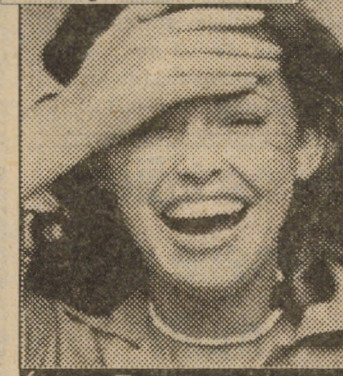
În pag. a II-a CALEIDOSCOP