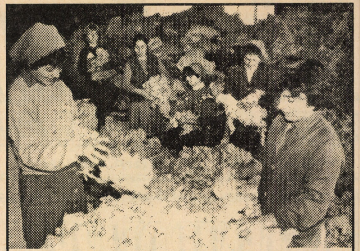
„Durerile tranziției” n-au ocolit, desigur, nici colectivul Societății Comerciale ORLATEX S.A. din Orlat, care a fost nevoită să-și reducă sensibil activitatea de producție... Un „balon de oxigen” s-a dovedit a fi reușita acțiune de achiziționare a lânii de la producătorii particulari, așa că muncitorii s-au pus de grabă pe scărmanat...

Pentru orașul Sibiu, sediul filialei și al Consiliului Județean M.E.R. este pe B-dul Victoriei nr. 14, programul de activitate fiind în zilele de luni, marți, joi după ora 17. Eventuale lămuriri se pot obține și după ora 10, în fiecare zi de luni până vineri.