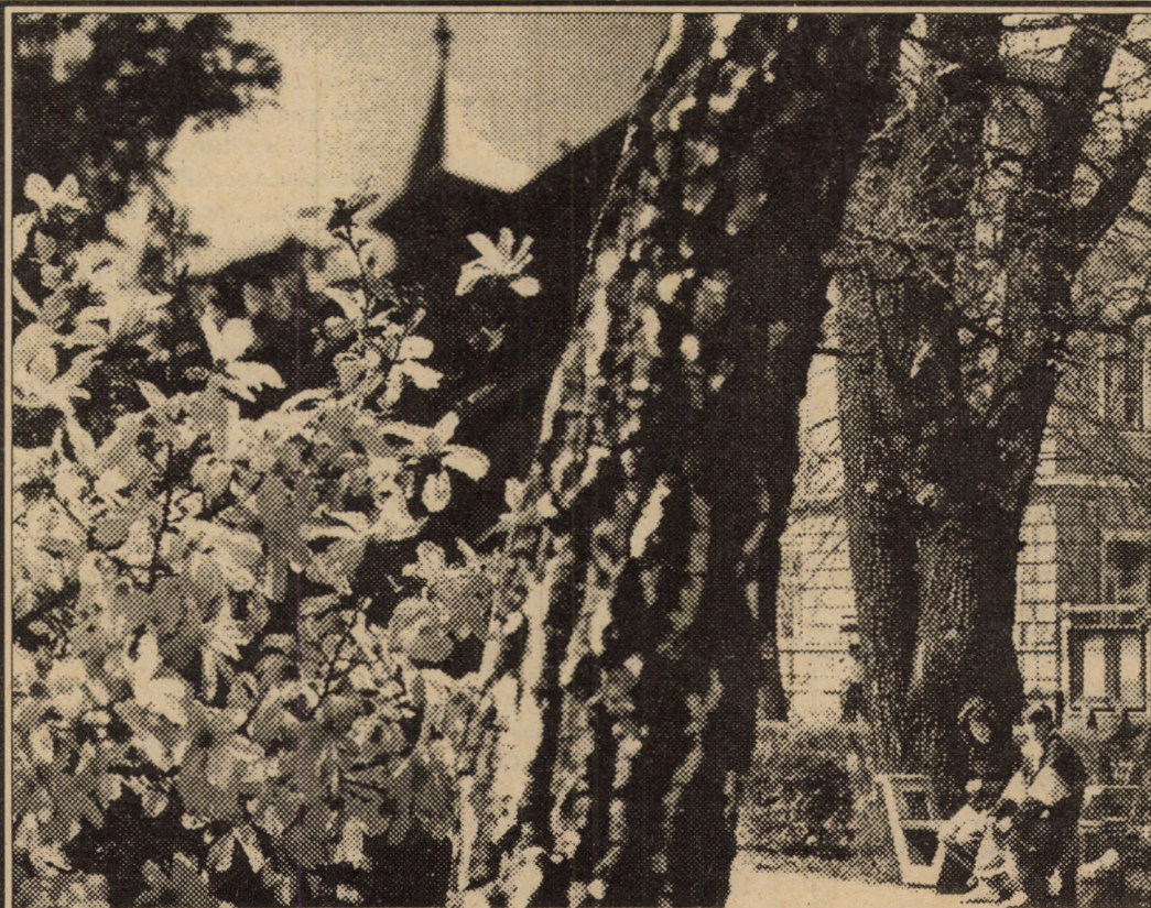
...Câine-câinește, iarna ultimă a renunțat teribil de greu să facă loc celui mai așteptat și frumos anotimp - PRIMĂVARA! Numai așa se explică faptul că abia după trei tentative ratate, superbe magnolii au răzbit a înflori, spre meritata încântare a ochilor noștri.

Și dacă așa ceva a fost posibil, te întrebi câți „evaziioniști” din aceștia or mai exista fără să-și știe nimeni? (I. CIOCAN)