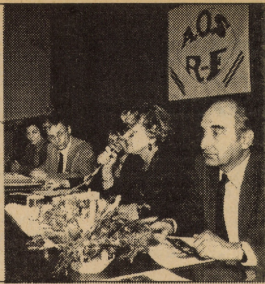
Săptămâna trecută, Sibiu a găzduit o manifestare de înaltă ținută: prima Reuniune științifică pe tema "Asistența stomatologică cotidiană", organizată de Asociația Odonto-Stomatologică Româno-Franceză, la care au participat 30 medici stomatologi francezi și peste 70 colegi de-ai lor din județul Sibiu și din alte județe din țară