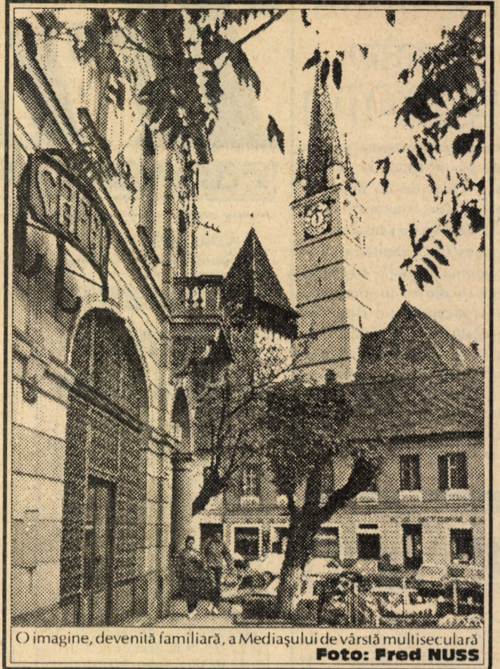
O imagine, devenită familiară, a Mediașului de vârstă multiseculară