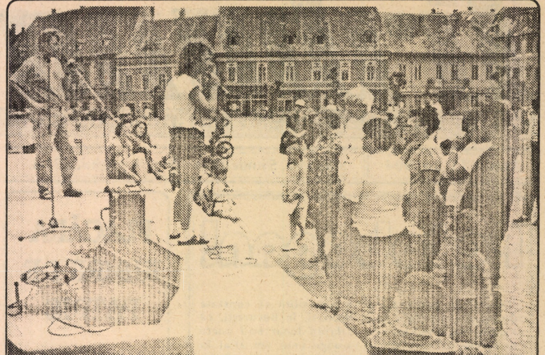
Scenă devenită cotidiană în Piața Mare, din Sibiu.

De curând, directorul Arhivelor Naționale Ruse, a declarat că rămășițele craniului lui Hitler se află la Moscova. Medicii francezi ar fi interesați să le examineze, dar oricum ar fi, plastografia comisă în mai 1945 de către medicii legiști ruși rămâne tot plastografie, chiar dacă a fost comisă sub presiunea unor ordine militare, relatează Le Monde.