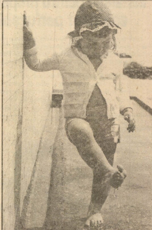
Oare mai apucăm zile de caniculă ?