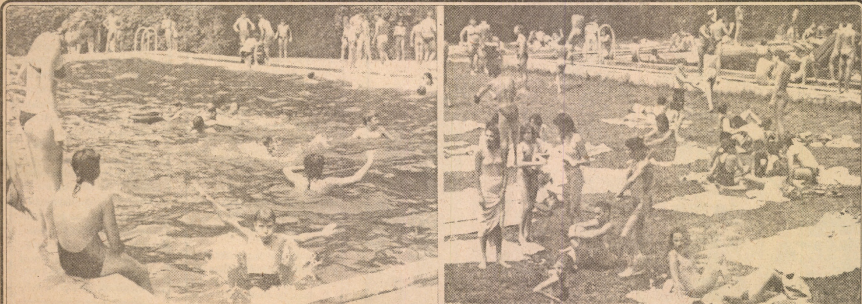
În aceste zile caniculare și totodată de binemeritate vacanță, tineri de toate vârstele își petrec câteva ore plăcute la Strandul Tineretului din parcul Sub Arini.