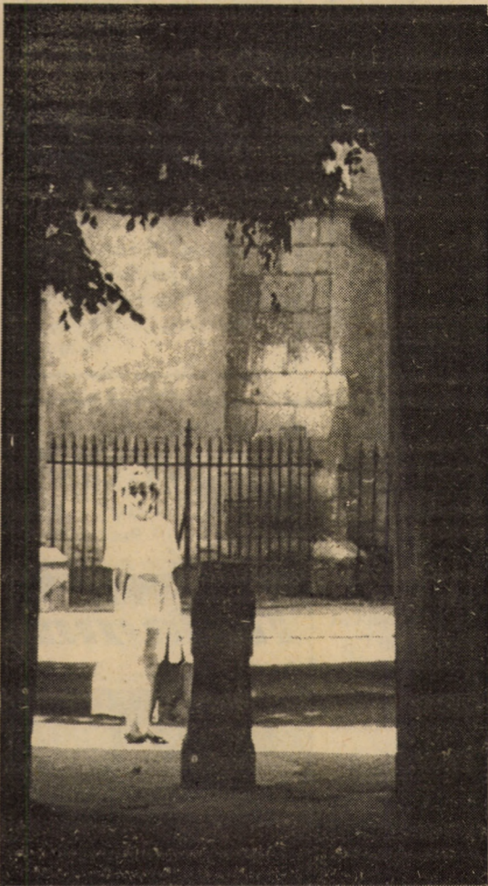
La capătul tunelului