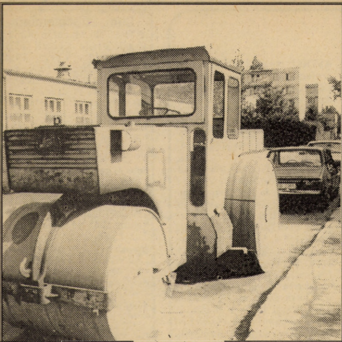
De o lună încoace compresorul zace! Parcat în apropierea casei șoferului, compresorul cu pricina ruginește în ploaie și vânt, iar singurii ce îl folosesc sunt copii din preajmă, care și-au găsit loc de joacă, transformând compresorul când în tanc, când în rachetă spațială. Oare în afara copiilor nimeni nu are nevoie de el?...