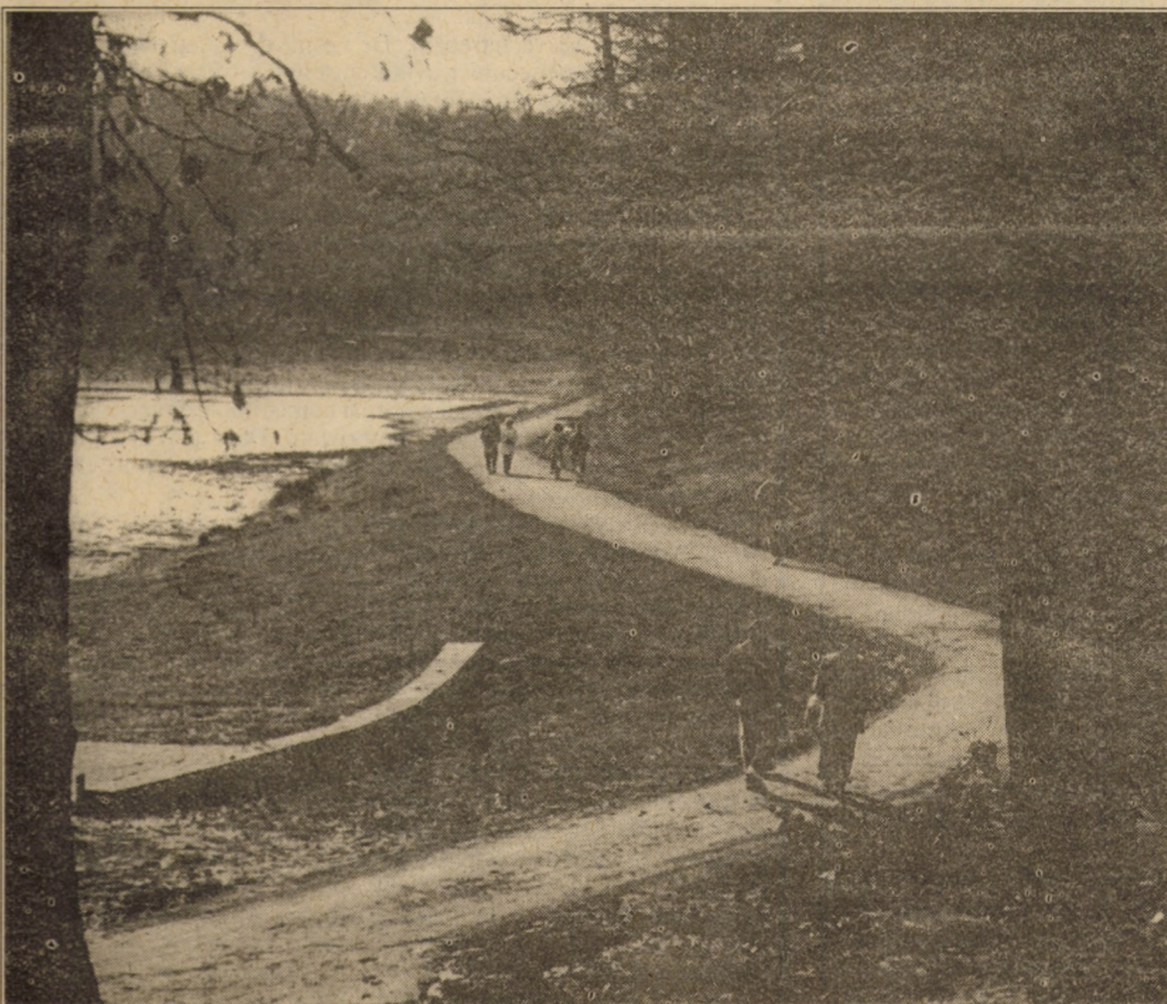
Plimbare de toamnă

A văzut, auzit și consemnat Lucian JIMAN