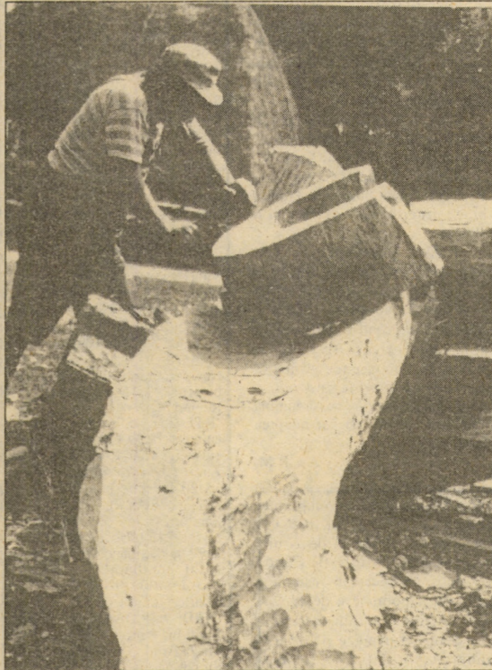
Ilustrațiile din această pagină reprezintă reproduceri după lucrări de sculptură aparținând sculptorului sibian Septimiu Enghis, cel care în prezent lucrează la transpunerea în marmură a monumentului dedicat lui Nicolaus Olahus ce poartă semnătura lui Imre Gyenge.