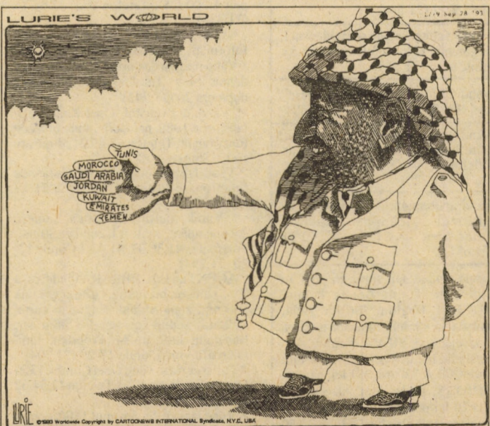
Mâna pe care premierul Rabin a strâns-o în realitate.

sediul Camerei Comunelor". Unul din semnatarii documentului, laburistul Dennis Turner, a explicat că în ultimul timp șoarecii se ivesc în cele mai neașteptate colțuri, și că la propunerile de a se folosi mijloace sofisticate el a spus doar "Luați o pisică". Domnul Turner, a cărui mătă este pe cale să nască, s-a oferit să doteze parlamentul, gratuit, cu unul-doi pisoi.