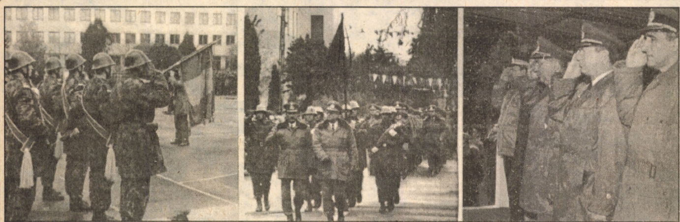
Sâmbătă, 6 noiembrie, în toate unitățile de învățământ militar s-au desfășurat festivitățile depunerii jurământului de credință față de patrie și popor de către studenții și elevii anului I de studiu. În fotomontaj - secvențe ale festivității de la Institutul de infanterie și chimie "Nicolae Bălcescu".