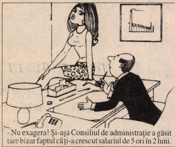
- Nu exagera! Și-așa Consiliul de administrație a găsit tare bizar faptul că și-a crescut salariul de 5 ori în 2 luni.

... Concluzia pe care ar trebui s-o tragem este că este necesar să luptăm cu probleme mari, urgente și complexe, pentru a minimaliza - dacă nu le putem evita - aceste "rele" înainte ca ele să devină de nestăpânit. Din păcate pe politicienii noștri post-revoluționari nu-i interesează decât puterea... (n.i.d.)