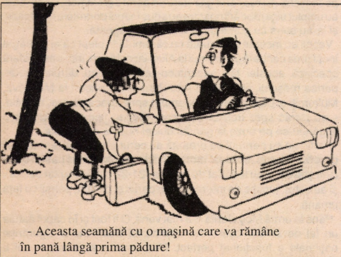
- Aceasta seamănă cu o mașină care va rămâne în pană lângă prima pădure!

- Bănuiesc eu că-i o țevă care trece pe sub mașină și care duce benzina la motor. Mi s-ar fi părut mai normal să fie amândouă la un loc. - Îmi puteți spune cum ajunge benzina în carburator? - V-am spus; prin țeava asta. - Direct, fără intermediar? - Da. - Dar dacă țeava trece pe sub mașină cum poate benzina să urce până-n carburator? - Evident că trebuie să urce... Trebuie să se fi mai găsit vreo drăcie. - Încă n-am vorbit de baterie. - Bateria? Asta face electricitate. Știu că trebuie să pui apă distilată-n ea și că vara trebuie mai multă decât iarna. - De ce este nevoie de electricitate într-o mașină? - Ca să funcționeze farurile, ștergătoarele și claxonul. - Numai pentru-atât? - Nu prea văd ce altceva ar mai fi. - N-ați băgat de seamă că dacă bateria e descărcată, demarajul rămâne fără rezultat? - Ba da, dar nu văd legătura. - Cum se-narcă bateria dumneavoastră? - De asta se ocupă la garaj, mai ales iarna. - Bateria dumneavoastră se-narcă numai la garaj? - Da, e-adevărat că se încarcă și când merge mașina. - Nu vă trece prin minte că acea curea despre care vorbeați adineauri ar putea să pue-n mișcare un dinam? - Despre asta chiar că nu știu nimic. De fapt, până astăzi num-am interesat niciodată de automobil... (Pe onoarea mea: n-am inventat nimic).