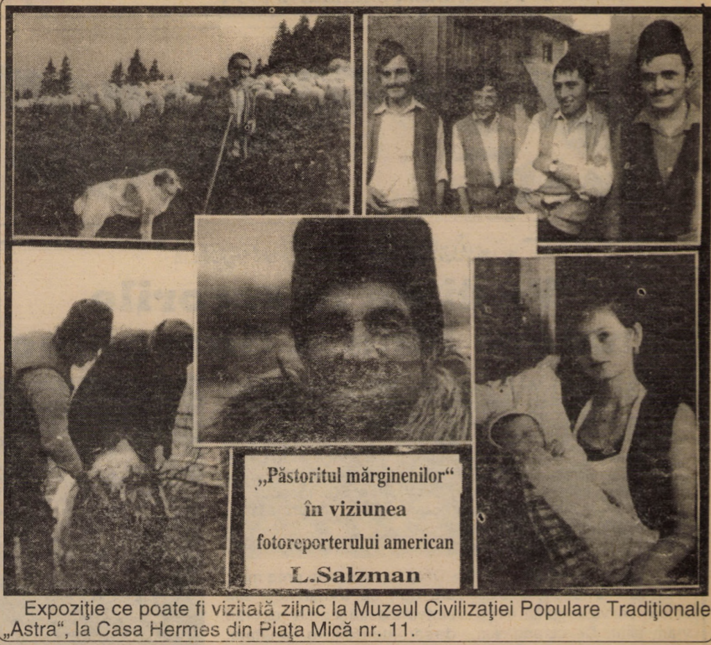
„Păstoritul mărginenilor“ în viziunea fotoreporterului american L.Salzman

Expoziție ce poate fi vizitată zilnic la Muzeul Civilizației Populare Tradiționale „Astra“, la Casa Hermes din Piața Mică nr. 11.