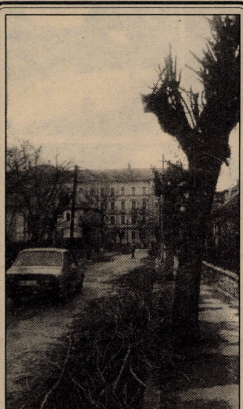
De curând pe străzile laterale din Calea Dumbrăvii (de ex. străzile Mărăști, Mărășești) a început toaleta de primăvară a copacilor. Foarte bine și frumos din partea edililor orașului, dar dacă tot au tăiat crengile copacilor oare de ce, de o săptămână le-au lăsat pe jos și nu le transportă pentru a descongiona strada?

Pe data de 1 februarie a.c. au primit cei care au trimis în 13 august 1993.