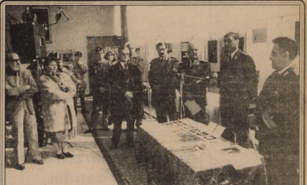
Salonul Internațional de fotografie "FOTOARM", organizat de Cercul militar din Sibiu, s-a deschis sub zodia fericită a unui eveniment cultural de excepție. Amănunte în ziarul nostru de mâine.