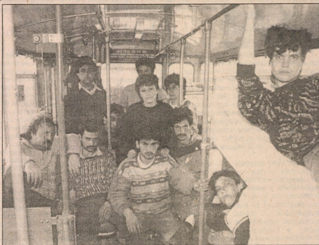
Cei 13 greviști ai foamei (stabiliți de vineri 11 martie în troleul 682) declară că își vor înceta acțiunea imediat după plecarea directorului și

consiliului de administrație și împreună cu colegii lor își vor relua lucrul.