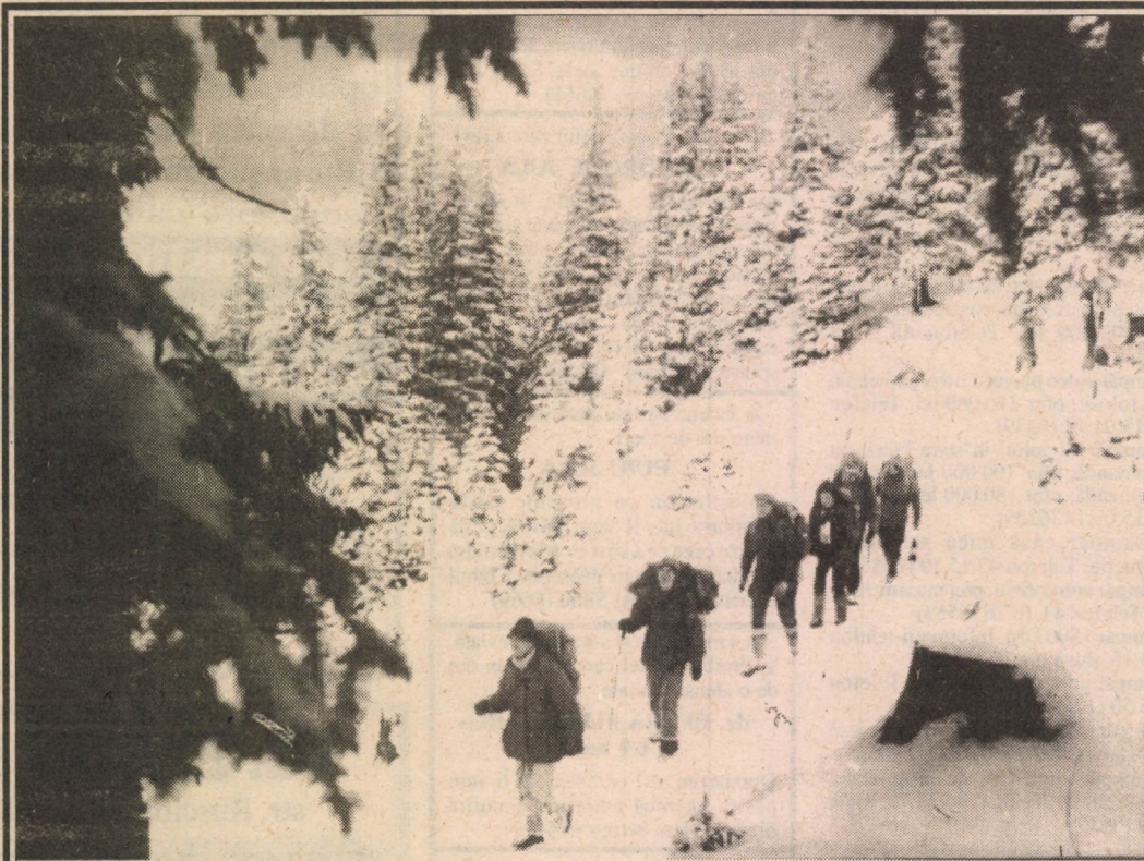
A plecat Baba Dochia. A venit fiisa - mai tânără, mai frumoasă și mai vicleană. La Păltiniș, aseară, cădeau din cer petale de narcise