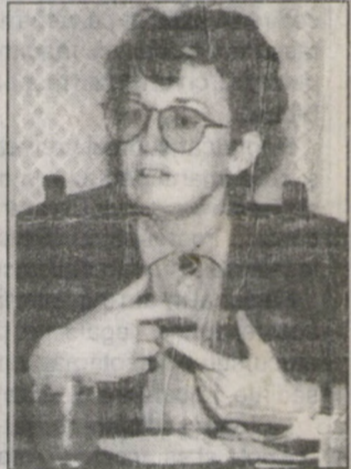
KAREN FOGG, ambasadorul Uniunii Europene la București. Vă prezentăm câteva secvențe din declarația doamnei ambasador.

leri, în ajunul deschiderii, la Sibiu, a lucrărilor Seminarului internațional "Gestiunea serviciilor publice locale", organizat în cadrul Programului PHARE, a avut loc conferința de presă a doamnei