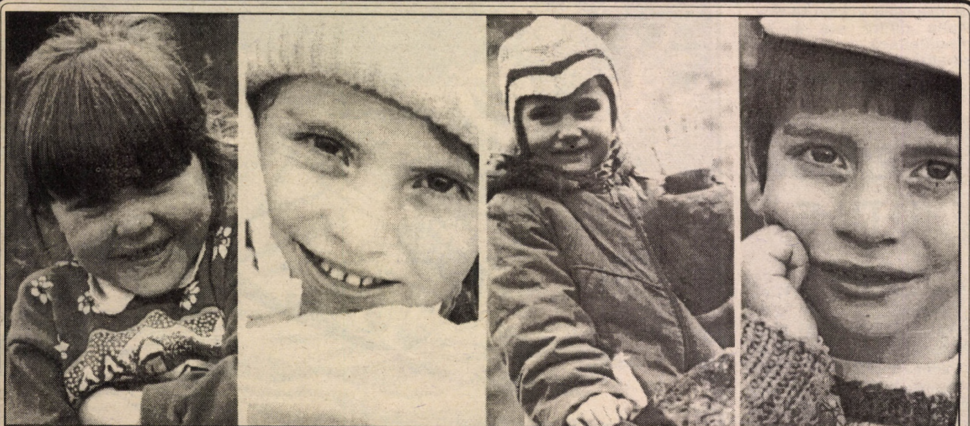
Unii încă la grădiniță, alții deja la școală (și acum în vacanță!), dar cu toții nerăbdători să se lepede, în sfârșit, de căciuli și mănuși, dornici să zburde mângâiați de soarele cald al primăverii.