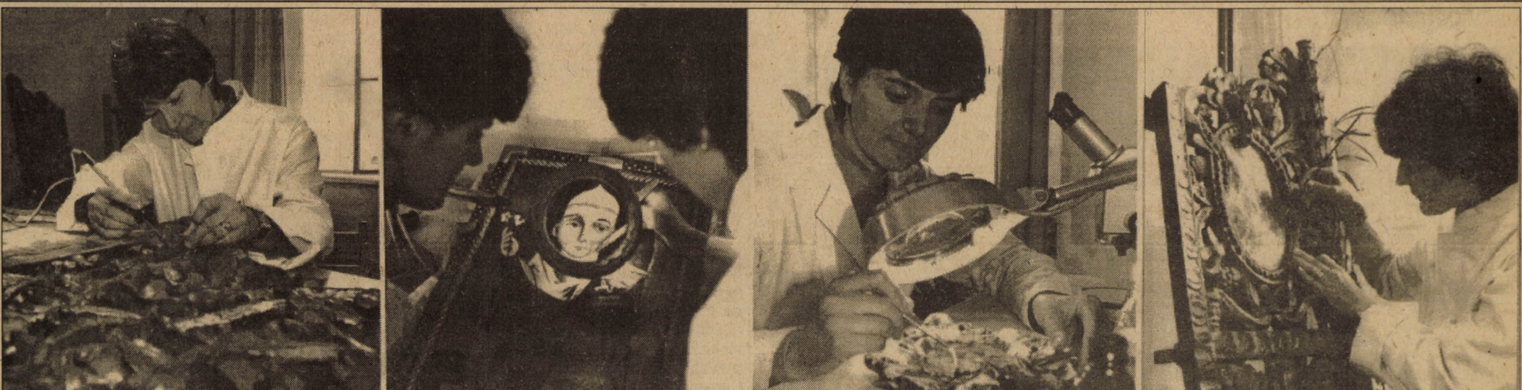
În Laboratorul de restaurare pictură al Muzeului Civilizației Populare Tradiționale "Astra" din Sibiu, succesele profesionale