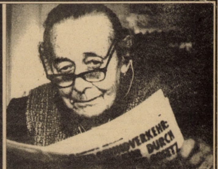
Imagini premiate la Salonul Internațional de artă fotografică, Sibiu 1994 - Cercul Militar