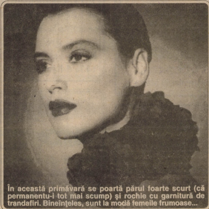
În această primăvară se poartă părul foarte scurt (că permanentu-i tot mai scump) și rochie cu garnitură de trandafiri. Bineînțeles, sunt la modă femeile frumoase...

Chelia îi costă pe australieni 50 milioane dolari anual atunci când ea afectează turmele de oi, anunță REUTERS. Australia, cel mai mare exportator mondial de lână, a fost confruntată cu o scădere dramatică a producției după ce 30 din cele 140 milioane de oi crescute pe continent au început să chelească. Boala se datorează stresului, afirmă cercetătorii, iar oaia este un animal sensibil și se stresează când e gravidă, când e vaccinată și chiar când e transferată de la o stână la alta. Din fericire, aceiași cercetători sunt pe cale de a pune la punct un soi din iarbă modificată genetic, care va conține un amino-acid (metionină) ce oprește căderea firelor de lână. În 1933, Australia a câștigat 3,3 miliarde din exportul de lână.