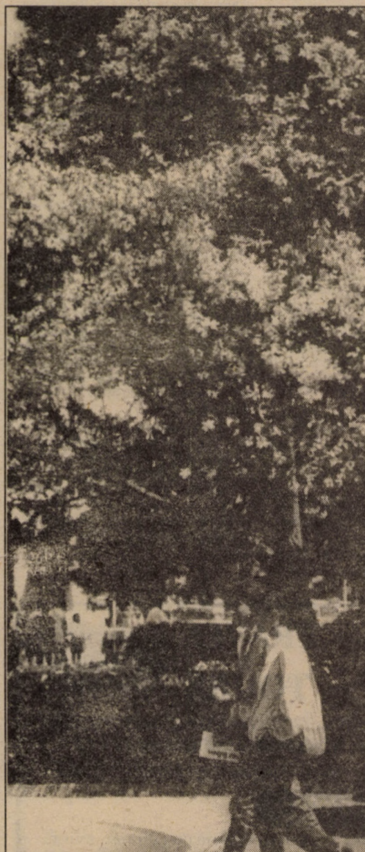
Odată cu explozia petalelor multicolore din această primăvară, în inimile noastre se deziăntuie bucuria existenței acestui curcubeu.

Dialog absurd - Mă tot uit și nu-nțeleg... - Nici eu. - Nici tu, ce? - Ce, ce? - Nu-nțeleg ce nu-nțelegi. - Aha! - Da! - Ce, da? - Nu ceda!... - Am înțeles! - Păi, vezi?... Teodor PORTĂRESCU