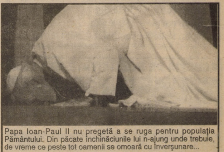
Papa Ioan-Paul II nu pregetă a se ruga pentru populația Pământului. Din păcate închinăciunile lui n-ajung unde trebuie, de vreme ce peste tot oamenii se omoară cu înverșunare...

Mafia își spală banii cumpărând obiecte de artă, ceea ce a dus la o creștere anormală a prețurilor în domeniu, au afirmat ieri magistratii italieni. Crima organizată s-a orientat către piața neagră a antichităților, sculpturi și picturi, pentru a-și recicla banii obținuți prin trafic de droguri și șantaj. Pe lângă furturile de artă la comandă, mafioții își pot cheltui banii murdari în mod "legal", cumpărând obiecte de licitație. Casele de licitație închid adeseori ochii la acest proces, pentru că în cazul cumpărătorilor cu dare de mână care nu cer chitanță, sunt scutite de plata impozitelor. De asemenea, în Italia s-au furat, în 1993, 29.000 lucrări de artă, din care doar 5.500 au fost recuperate. După cum informează REUTERS, deschiderea granițelor europene face aproape imposibilă misiunea poliției de a pune capăt acestui trafic.