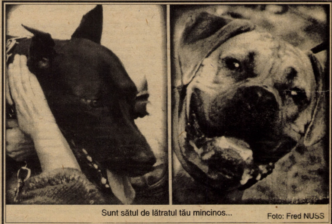
Sunt sătul de lătratul tău mincinos...