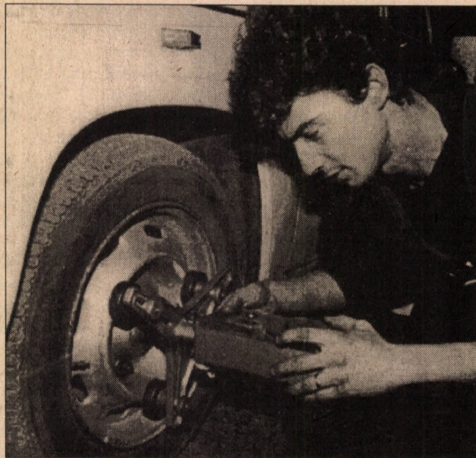
Unghiuri fotografice... și reglarea unghiurilor de fugă la autoservice-ul S.C. "BOAR MIHAI" S.R.L.