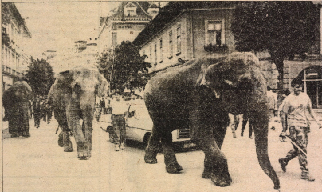
Spre deliciul copiilor din oraș și pentru reclamă circului GÄRTNER AUSTRIA și-a plimbat prin tot orașul enormele sale pachiderme. Bineînțeles că elefanții n-au fost prea cuminiți și s-au dedat la tot felul de "drăgălășenii" cu spectatorii care îi însoțeau.