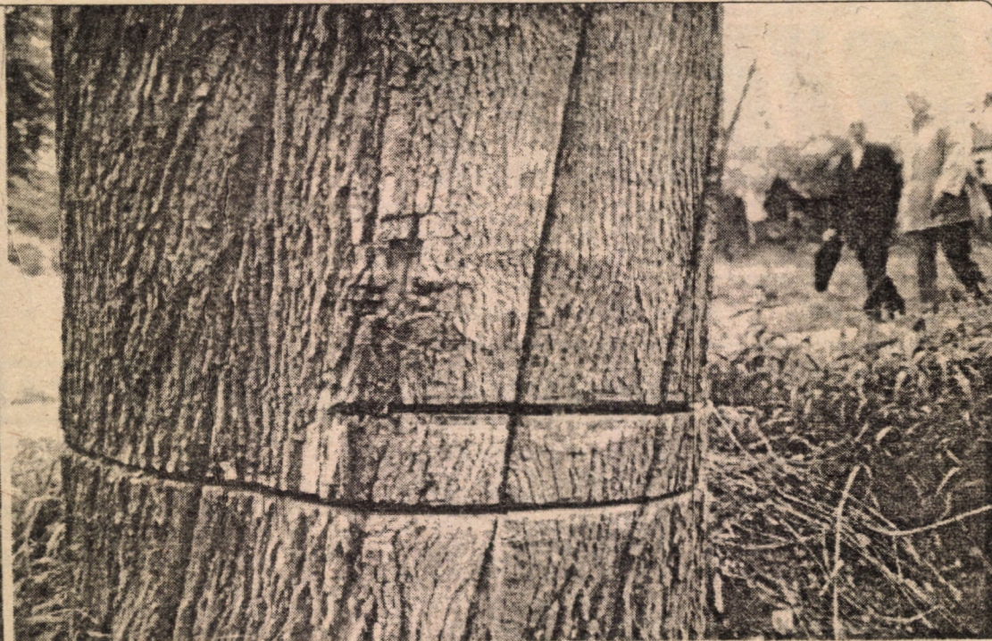
În parcul "Sub Arini" câțiva cetățeni certați cu legea au o metodă originală de a-și procura lemn de foc. Taie cu drijba copacii la rădăcină (imaginea din dreapta) și după ce aceștia se usucă îi taie "în liniște pentru că sunt... uscați". Uneori folosesc alte metode: Când nu este nimeni în parc, seara și mai ales când plouă, taie copacul (imaginea din stânga) și apoi noaptea vin cu căruțele pentru al transporta. Așa s-a întâmplat duminică, 6 mai a.c., în parcul "Sub Arini" și... cercetările continuă.