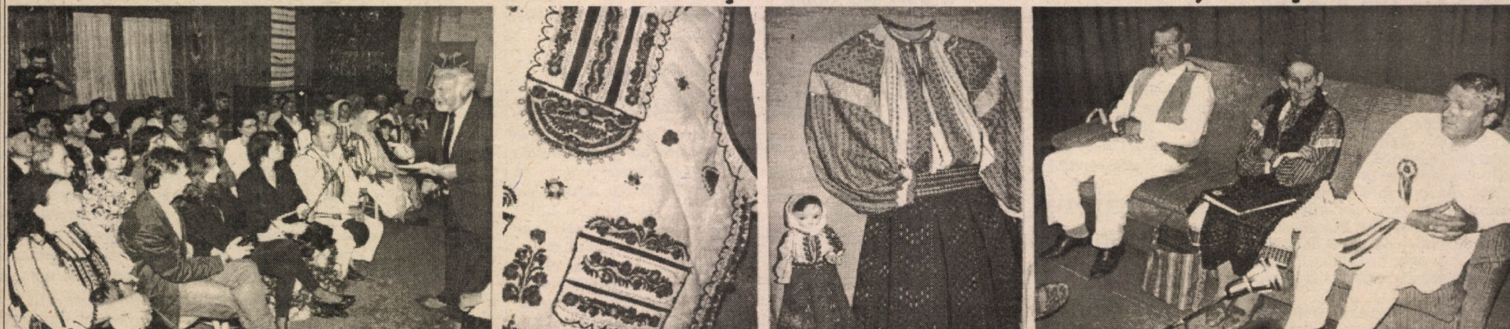
Ieri, la Muzeul Civilizației Populare Tradiționale ASTRA din Dumbrava Sibiului au fost