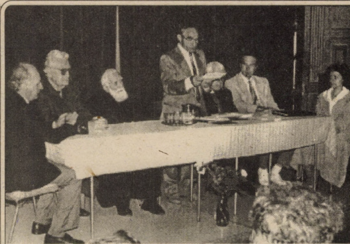
În organizarea Asociației medicilor catolici din România, filiala Sibiu, sâmbătă 28 mai 1994 s-a desfășurat sesiunea de comunicări "Familia și morala creștină în atenția medicală". Manifestarea face parte dintr-o suită de sesiuni științifice