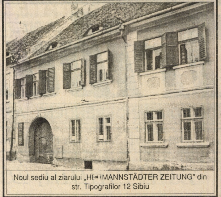
Noul sediu al ziarului "MANNSTÄDTER ZEITUNG" din str. Tipografilor 12 Sibiu