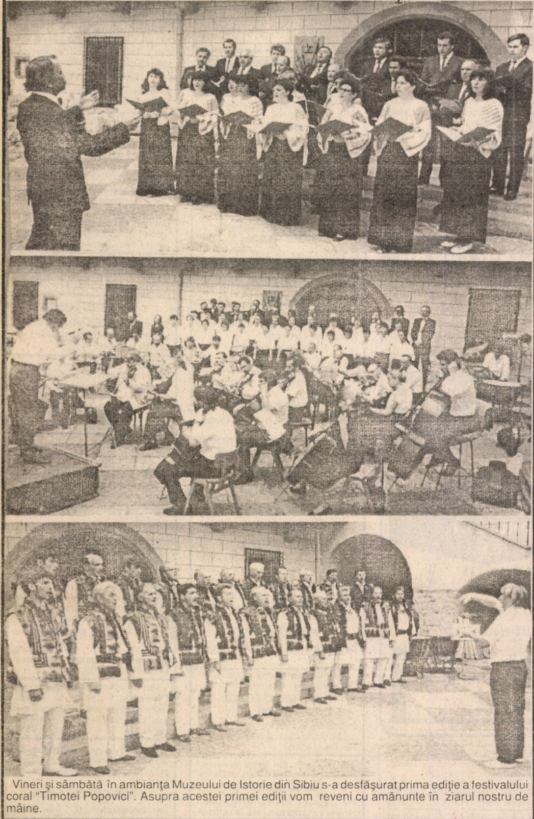
Vineri și sâmbătă în ambianța Muzeului de Istorie din Sibiu s-a desfășurat prima ediție a festivalului coral "Timotei Popovici". Asupra acestei primei ediții vom reveni cu amănunte în ziarul nostru de mâine.