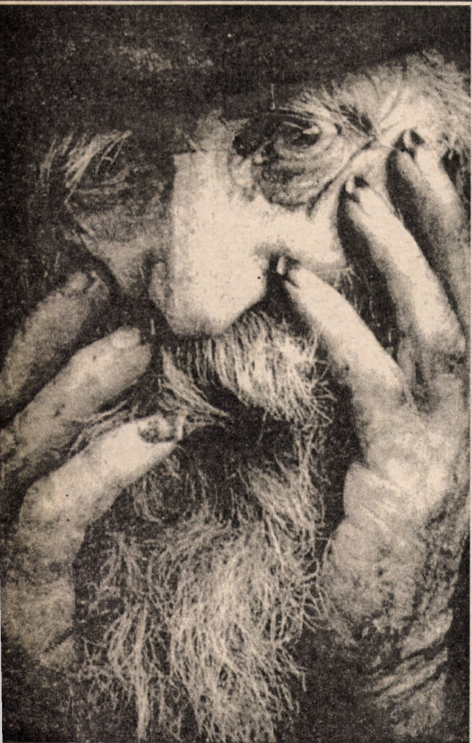
De curând, la Cercul Militar din Sibiu a avut loc jurizarea celui de al șaselea Salon Internațional de fotografie al fotoclubului ORIZONT. Din cele 1200 de lucrări primite, au fost selectate 500 de imagini imaginea de mai sus este una din cele premiate, care au intrat în concurs și care au fost încoronate cu 9 medalii FIAP (6 mențiuni FIAP), 9 medalii ale fotoclubului ORIZONT. Au mai acordat premii: Inspectoratul pentru Cultură al județului Sibiu, Cercul Militar, Primăria și Prefectura județului Sibiu. Am aflat, prin amabilitatea domnului Lăzăroiu, că salonul va fi deschis în prima duminică a lunii septembrie (4 sept.), tot atunci efectuându-se și decernarea premiilor.