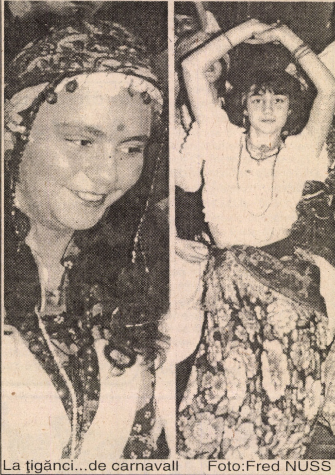
La țigănci...de carnaval

Un antreprenor de pompe funebre a străbătut 900 km până să-și dea seama că a uitat chiar "obiectul muncii" - cadavrul celui ce urma să fie îngropat, informează REUTER. Omul, plecat de la o morgă din vestul Germaniei, se îndrepta spre locul unde urma să fie îngropat decedatul, în Zagreb, Croația. La granița germano-austriacă a fost anunțat de partenerul de afaceri că a uitat să încarce în mașină corpul decedatului. Antreprenorul s-a întors imediat la morgă să ridice sicriul buclucaș.