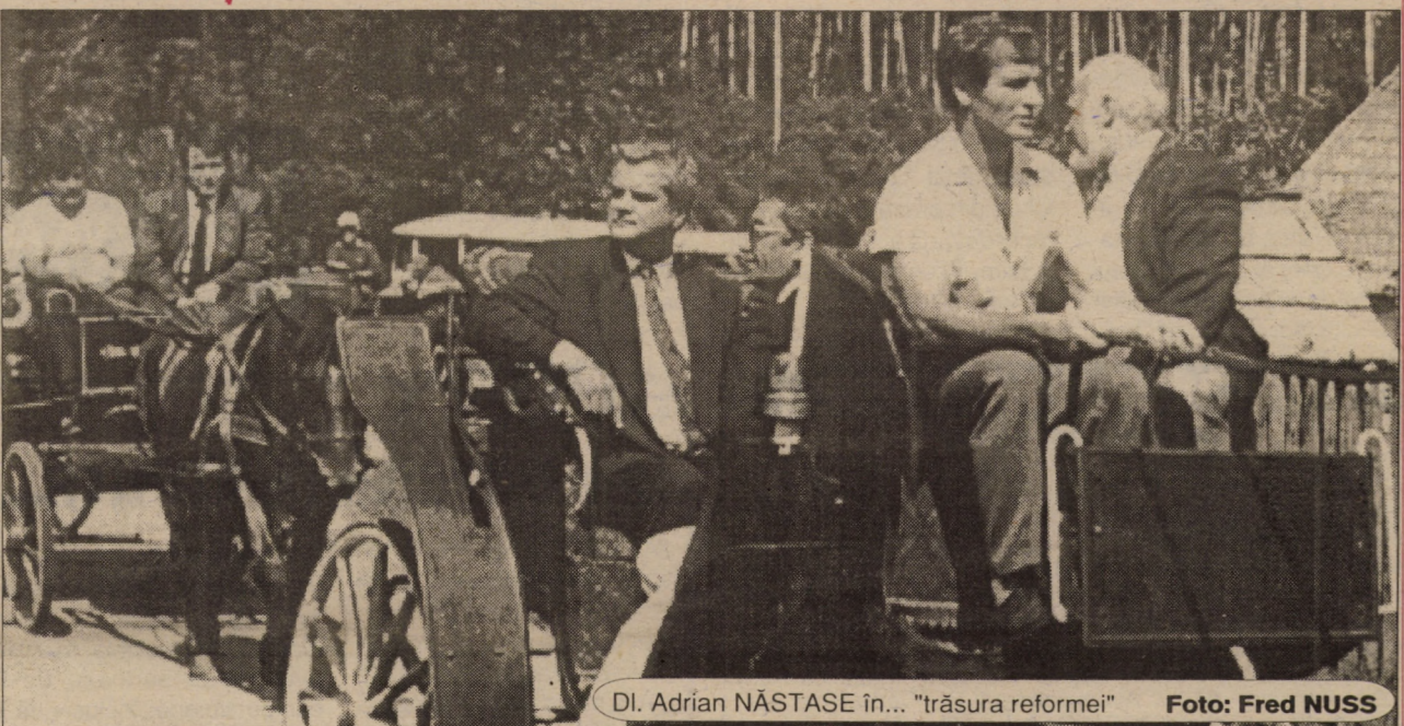
Dl. Adrian NĂSTASE în... "trăsura reformei"