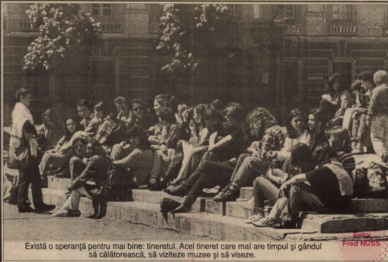
Există o speranță pentru mai bine: tineretul. Acel tineret care mai are timpul și gândul să călătorească, să viziteze muzee și să viseze.