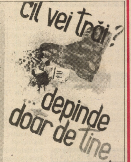
prezentăm, în ordine (de la stânga la dreapta) lucrările premiate (Locurile I, II, III)