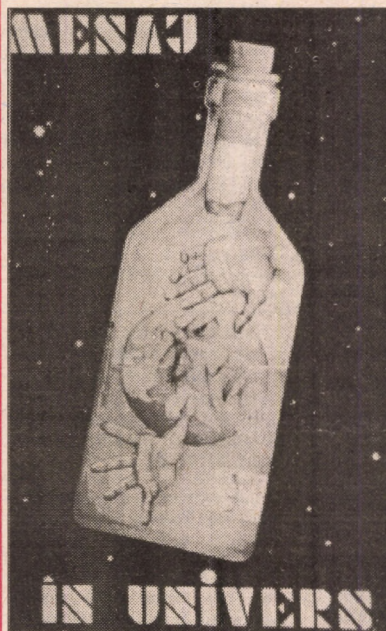
Cu ocazia "Zilei inimii", la sediul U.S.S.M., filiala Sibiu, a fost organizată o interesantă expoziție de colaje, realizată de membrii Clubului copiilor Sibiu și elevii Liceului de Artă. Vă

Ea este privită cu multă considerație atât pe plan național cât și internațional.