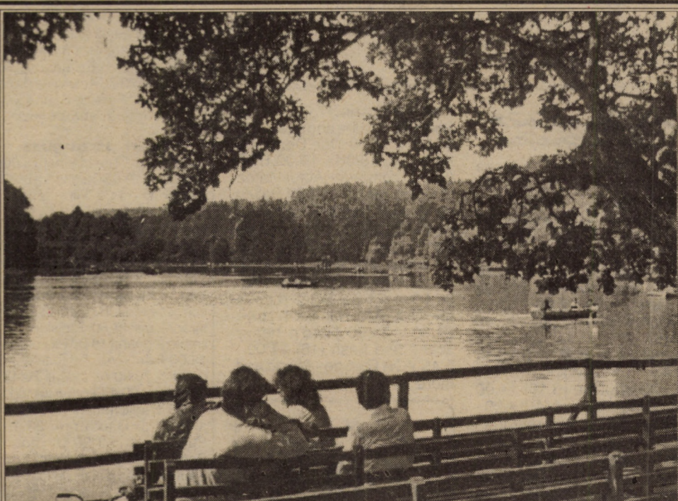
Dacă, în aceste zile caniculare, cui va se pare prea încins asfaltul străzilor, n-are decât să se răcorească la umbra stejarului multiseclar, la marginea lacului din frumoasa noastră Dumbrăvă.

Despre cum s-au derulat lucrurile în continuare, vă oferim amănunte în pag.8.