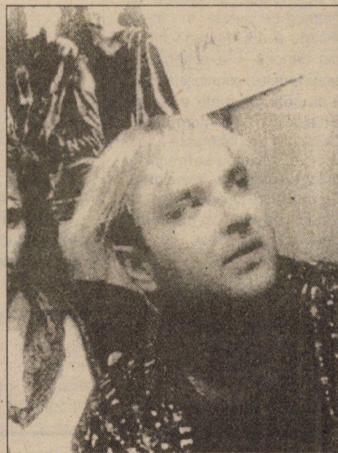
Premiul I - videoclip - Linga, Letonia