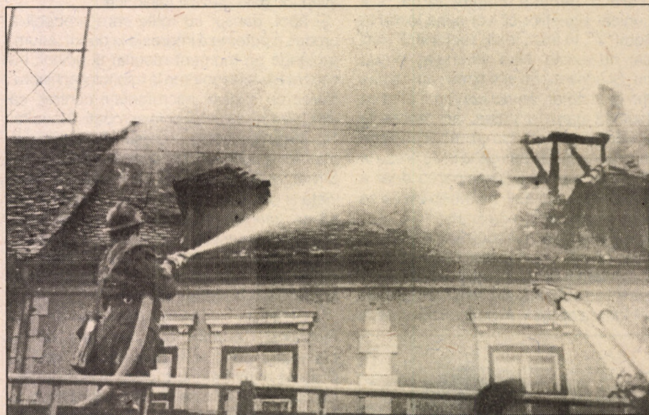
Cu fruntea sus

și Compania din Sibiu să-și construiască un sediu reprezentativ în cartierul Ștrand și să dispună de o dotare corespunzătoare unor intervenții rapide și eficiente pentru toate cazurile și situațiile. Țin să remarc însă faptul că toată această tehnică nu ar avea nici o valoare dacă nu ar fi oamenii, măsura în care foștii mei colegi se dăruiesc misiunii lor. Privită din afară, misiunea nu este simplă. Cadre sau militari în termen se află într-un continuu proces de instruire, de însușire a unor deprinderi și cunoștințe, dezvoltarea gândirii tactice, cunoașterea pericolelor,