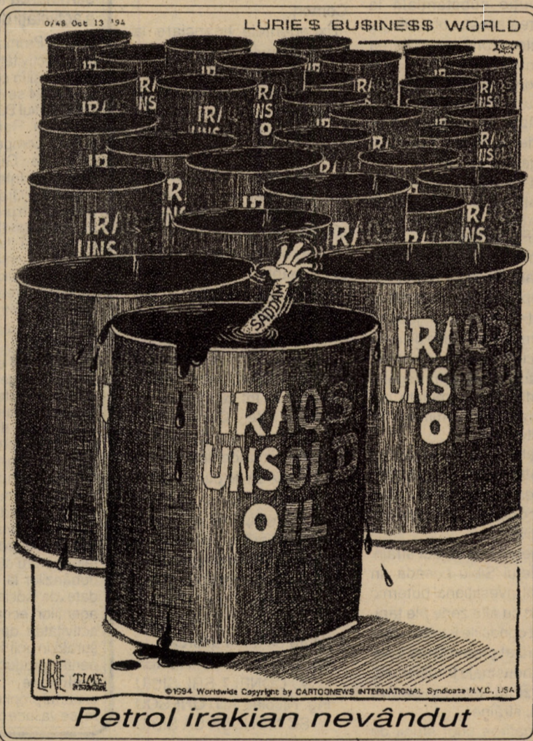
Petrol irakian nevândut