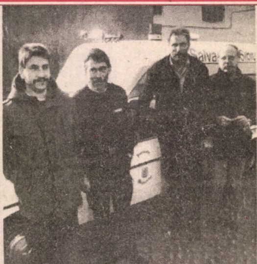
mobil de urgență și reanimare, care funcționează sub oblăduirea pompierilor sibieni. Aflând despre necazurile echipei Salvamont Sibiu, câțiva oameni de suflet din echipa pompierilor din Wupperthal au