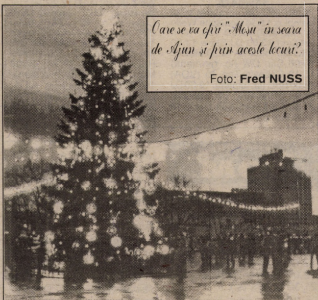
Care se va scrie "Moșii" în seara de Ajun și prin aceste locuri?