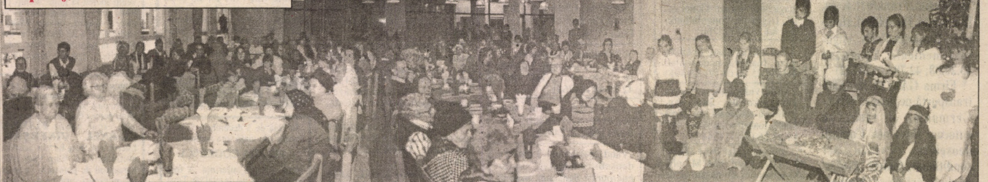
Duminiță după masă, viitorii locatari ai Căminului-Spital "Dr. KARL WOLF" din Sibiu au fost invitați să participe la o întrunire de cunoaștere reciprocă, în frumoasa sală de mese a căminului. De asemenea invitat, un grup de copii din Cârța, inițiat de preotul german REHNER, din comună, a prezentat o frumoasă scenetă cu nașterea lui Hristos, oferind totodată celor prezenți un program de colinde.