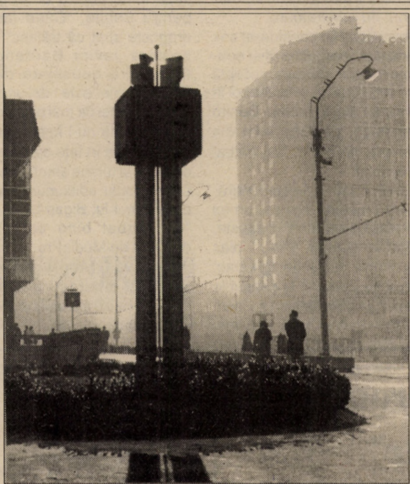
... În Sibiu, când nu plouă sau ninge, bate vântul... Când nu bate vântul, este ceață... Când este ceață și soarele „dă din coate” să răzbească, atunci „ochiul” iscoditor și sensibil al aparatului de fotografiat surprinde jocul tandru al umbrelor - încă un farmec specific Sibiului!

Sunt însă multe alte întrebări care ne frământă, neantizând un optimism și așa șubred. De pildă: ce înseamnă acest 1,43 la sută